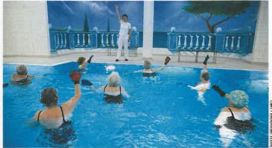
Patienten bei der Physiotherapie: Eine neue Form von Zweiklassenmedizin

Zwei Jahre später gelang ihr der Wechsel in einen spürbar preisgünstigeren Tarif zu 354 Euro. Hinzu kamen jedoch 1000 Euro Selbstbeteiligung im Jahr. Auch diese Prämie stieg weiter an. Am Ende blieb der Frau nichts anderes übrig, als freiwillig auf Leistungen zu verzichten. Im vergangenen Jahr schrieb sie an die Axa, sie habe „bereits genehmigte Behandlungen“ absagen müssen, auch eine Schulteroperation. Nun müsse sie „mit den ein-