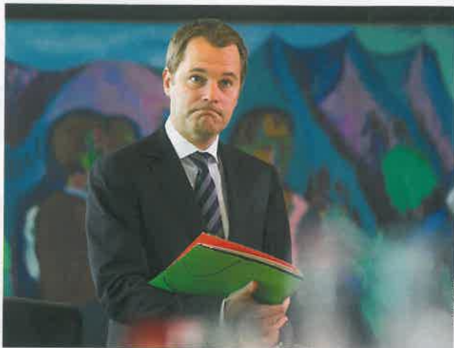
Gesundheitsminister Bahr: Appell an die Eigenverantwortung der Versicherungen

Untersucht haben sie 32 PKV-Unternehmen. Grundlage waren 208 Tarifsyste-me mit insgesamt 1567 Kombinationen. Das Ergebnis: Keine Versicherung kann die 85 Kriterien erfüllen.